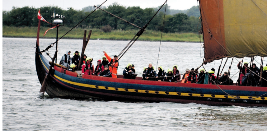
KILDE: DET DANSKE VÆKSTMIRAKEL, AF CARL-JOHAN DALGAARD, KØBENHAVNS UNIVERSITET, NOVEMBER 2010

Kyst/areal viser, hvor lang kystlinjen er i forhold til arealet. Danmarks areal er eksempelvis tæt på 43.000 kvadratkilometer. 17 pct. af de 43.000 giver en kystlinje på 7.310 kilometer.